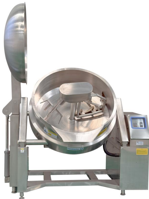
Рис №2 Модель – ХQC-110DX. Внешний вид модели и тип месильного органа

Модель – ХQC-110DX Напряжение, частота -380 В/50 Гц Общая номинальная мощность оборудования: 28,75 кВт Мощность нагревательного элемента ТЭНа: 24 кВт Мощность электродвигателя мешалки: 4 кВт Максимальна/минимальная загрузка дежи: 5 до 390 литров Габаритные дежи: диаметр 1095 мм* глубина 370мм Объем дежи: до 400 л Терморегулятор 0 - 230°C Скорость вращения – 29 об/мин Скребки (мешалки) – 8 шт. (лопасти) Объем теплоносителя для заполнения №320 – 80 (±1) литров Габаритные размеры оборудования - 1800*1320*1220 мм Габариты упаковки: 1900*1420*1400 мм Вес нетто/брутто – 680/780 кг