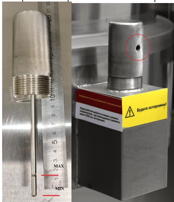
Рис.№3 Отметка уровня теплоносителя на шупе. Вентиляционное отверстие масляной рубашки

При нагреве возможно проявление паров масла из заливной горловины.